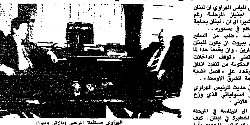
الهراري مستقبلا للرئيس (الراي وديار)